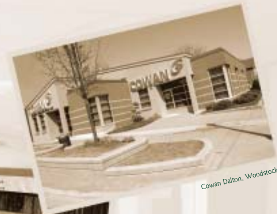
Cowan Dalton, Woodstock