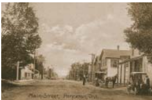
Princeton (Ontario) vers 1908. Carte postale.