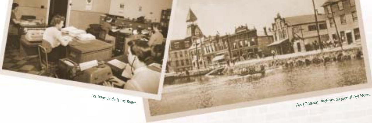
Les bureaux de la rue Buller.