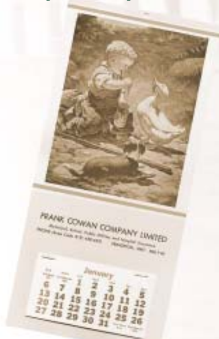
Le calendrier « Cowan Boy », associé à la compagnie pendant des dizaines d'années.

zone de travail complètement aménagée en espace fonctionnel, tout à fait évoluée, ayant été dotée de plusieurs commodités technologiques modernes. Un standard central acheminait promptement les communications téléphoniques et un essaim d'employés émerveillés s'agitaient autour de la photocopieuse. « Quel sens de la démocratie » a observé un courtier de la Lloyd's of London qui visitait nos locaux, en constatant un manque visible de bureaux séparés tandis qu'il parcourait les locaux à aire ouverte du nouvel édifice. Sa remarque concise était plus près de la vérité qu'il ne l'aurait cru, car l'aménagement des surfaces de travail reflétait l'aspect démocratique du fonctionnement de la « société » Cowan. En effet, les anciens employés comme les employés actuels n'ont que de bons mots à l'endroit de la société Frank Cowan et de la camaraderie, de l'ambiance égalitaire et de l'éthique sérieuse qui règnent et qui coexistent dans ce milieu de travail. Certains ont même laissé entendre qu'en réalité ces trois caractéristiques sont mutuellement dépendantes. Il ne fait aucun doute qu'il s'agit d'une recette gagnante de l'entreprise.