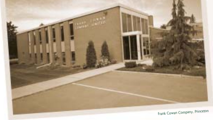
Frank Cowan Company, Princeton