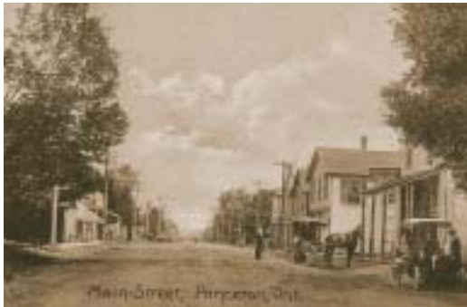
Princeton (Ontario) vers 1908. Carte postale.