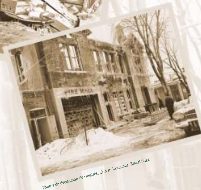
Photos de déclaration de sinistres. Cowan Insurance, Bracebridge

consiste à servir les besoins des demandeurs ou ayants droit dans toute la mesure du possible. Les partenariats que la Cowan a établis avec ses assureurs sont tout aussi importants; il s'agit de liens de collaboration essentiels auxquels l'entreprise accorde de la valeur et qu'elle s'efforce continuellement d'honorer. En servant simultanément ses propres intérêts et ceux de ses clients et de ses assureurs, la Cowan n'est pas à la remorque d'objectifs incompatibles. Au contraire, cette formule à trois volets répond le mieux aux desseins de l'entreprise, favorise de nombreux succès probants et permet à la Cowan de mieux affronter les ralentissements cycliques de ses activités.