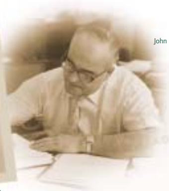
John Kennedy, 1966.