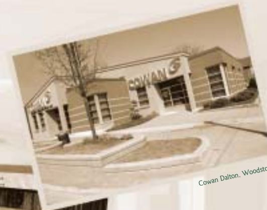
Cowan Dalton, Woodstock