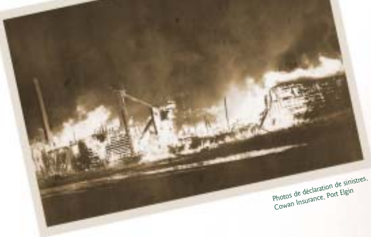
Photos de déclaration de sinistres. Cowan Insurance, Port Elgin